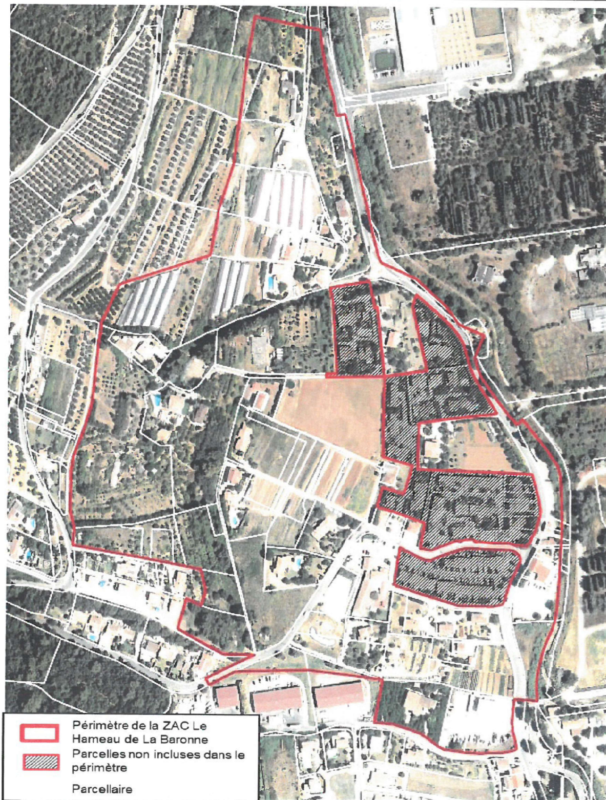
Annexe n°1 : Périmètre de la ZAC délimité par un trait rouge sur le plan au 1/1000°